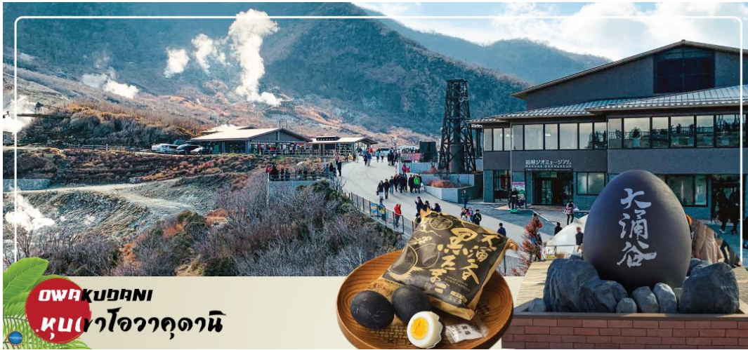
OWAKUDANI หุบเขาโอวาคุดานิ

จากนั้นนำท่าน ชมวิหะเลสาบ ๓ ศาลเจ้าฮาโกเนะ (Hakone Shrines) (ใช้เวลาเดินทางประมาณ 30 นาที) ศาลเจ้าเก่าแก่ในศาสนาชินโต ตั้งอยู่บริเวณตีนเขาฮาโกเนะ และอยู่ริมทะเลสาบอะชิ จังหวัดคานากาวา ประเทศญี่ปุ่น ไฮไลท์!!! เส้าโทริอิสี่แดง ริมทะเลสาบที่เป็นจุดถ่ายรูปยอดนิยม อีสาระให้ท่านขอพรและถ่ายรูปตามอัธยาศัย