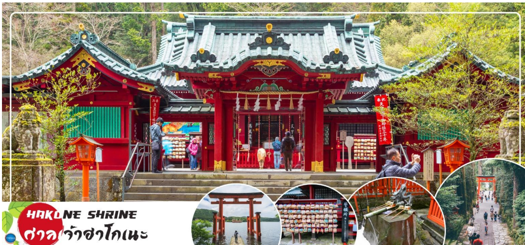
HAKONE SHRINE ศาลเจ้าฮาโกเนะ

จากนั้นนำท่าน ชมวิหะเลสาบ ๓ ศาลเจ้าฮาโกเนะ (Hakone Shrines) (ใช้เวลาเดินทางประมาณ 30 นาที) ศาลเจ้าเก่าแก่ในศาสนาชินโต ตั้งอยู่บริเวณตีนเขาฮาโกเนะ และอยู่ริมทะเลสาบอะชิ จังหวัดคานากาวา ประเทศญี่ปุ่น ไฮไลท์!!! เส้าโทริอิสี่แดง ริมทะเลสาบที่เป็นจุดถ่ายรูปยอดนิยม อีสาระให้ท่านขอพรและถ่ายรูปตามอัธยาศัย